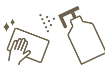
定期消毒の強化 Regular sanitisation

各フロアにおけるロビーや、レストラン、ショップ、化粧室に消毒液を設置しております。 We set sanitisers at lobby, restaurants, shops, and bathrooms at each floor.