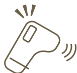
出勤時の体調、健康管理

Physical condition is checked at time of the attendance.