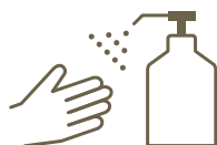
消毒液の設置 Setting sanitisers

各フロアにおけるロビーや、レストラン、ショップ、化粧室に消毒液を設置しております。 We set sanitisers at lobby, restaurants, shops, and bathrooms at each floor.