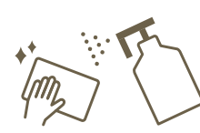
スタッフ共有部、オフィスにおける消毒の強化

Sanitisation of office and common space for staff